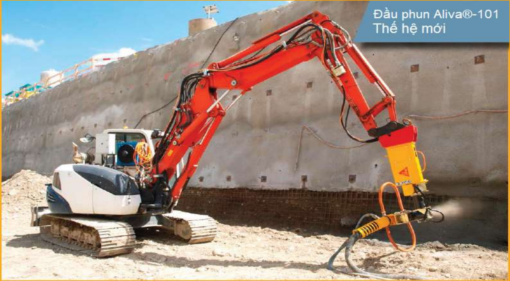
Đầu phun Aliva®-101 Thế hệ mới